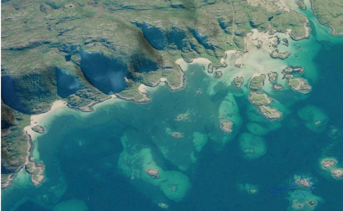
Strendene mellom Forrabalten og Måsvik. Illustrasjon fra ortofoto. Nord er mot venstre.

Noen av områdene som berøres er de desidert fineste områdene på kysten i Tromsø. Og området Måsvik og sørvestre del av Rebbenesøya er unikt både lokalt, regionalt og på nasjonalt nivå. Derfor er det underlig at denne strekningen ikke er bedre dokumentert i konsekvensutredningen.