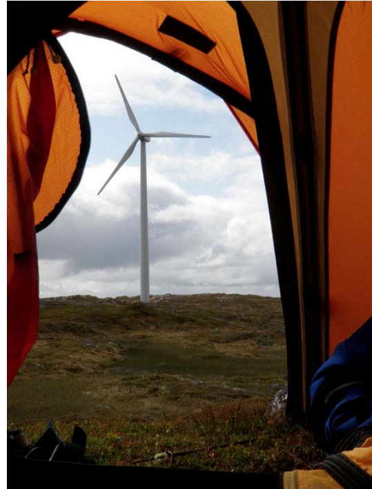
Telting ved vindturbinen på Sandhaugen, Kvaløya. 80 meter høy og 72 meter rotordiameter. Bildet er tatt med vidvinkel.

Hvordan er friluftsliv, 300 meter ved siden av vindturbinen på Sandhaugen testfelt, Kvaløya? Størrelsen er betydelig, visuelt dominerende. Det som gjør mest inntrykk er støy, både mekanisk og rotorstøy, som kan sammenlignes med propellfly som takser. Det er ikke noe spesielt høyt lyd, men en evigvarende lyd som skaper problem. Og som passer dårlig sammen med friluftsliv hvor målet er å oppleve natur. I telt så er det ingenting som demper lyden. En direkte sammenligning med planlagt vindpark Måsvik er vanskelig da det er flere forskjeller. Måsvik vil evt. få mer moderne turbiner, litt annen størrelse, og har helt annen topografi.